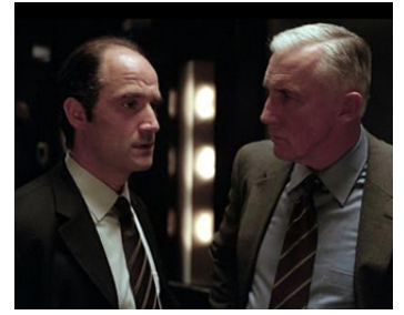
2002 DOMMAGE COLLATÉRAL (Collateral Damage) d'Andrew Davis avec Madison Mason