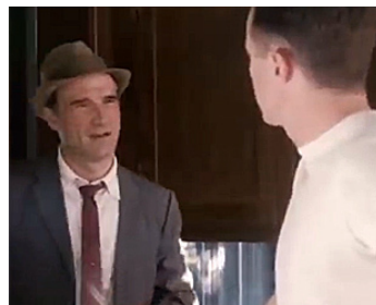
2010 THE KILLER INSIDE ME de Michael Winterbottom avec Casey Affleck