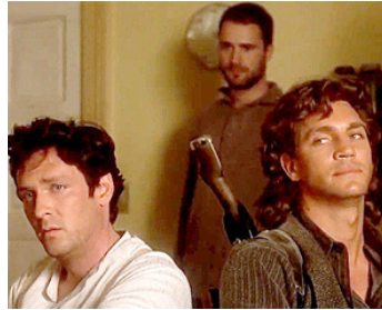
1989 UN FUSIL POUR L'HONNEUR (Blood Red) de P. Masterson avec M. Madsen, Eric Roberts