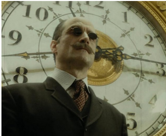
2009 L'ÉTRANGE HISTOIRE DE BENJAMIN BUTTON de David Fincher