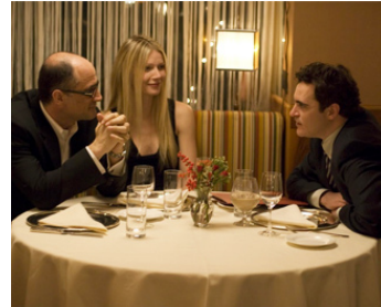
2008 TWO LOVERS (Two Lovers) de James Gray avec Gwyneth Paltrow, Joaquin Phoenix