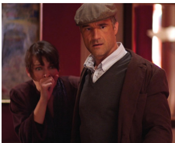
2010 PHÉNOMÈNES PARANORMAUX (The Fourth Kind) d'O. Osunsammi avec Mila Jovovitch