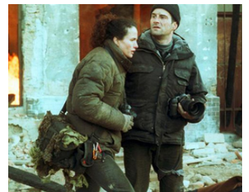
2000 HARRISON'S FLOWERS d'Élie Chouraqui avec Andie MacDowell