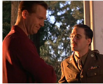
1988 TUCKER (Tucker, the Man and his Dream) de Francis Ford Coppola avec Jeff Bridges