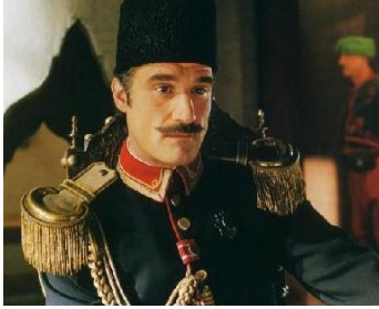
2002 ARARAT (Ararat) d'Atom Egoyan