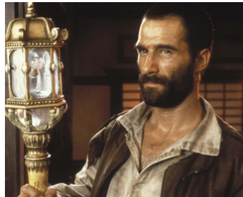
1993 LES TORTUES NINJA 3 (Teenage Mutant Ninja Turtles III) de Stuart Gillard