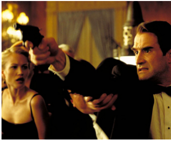
2000 LES ÂMES PERDUES (Lost Souls) de Janusz Kaminski avec Sarah Wynter