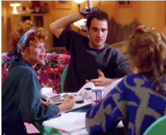
1990 ALLÔ MAMAN, C'EST ENCORE MOI d'Amy Heckerling avec Kirstie Alley, Twink Caplan