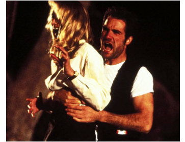
1990 LA MAISON DES OTAGES (Desperate Hours) de Michael Cimino avec Kelly Lynch