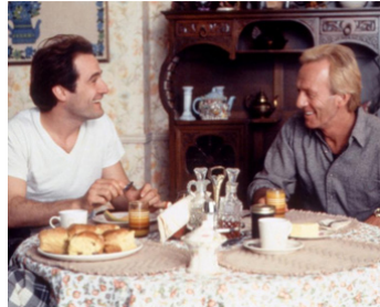
1990 UN ANGE... OU PRESQUE (Almost an Angel) de John Cornell avec Paul Hogan