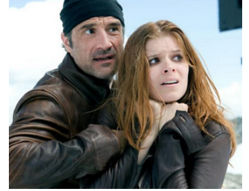
2007 SHOOTER, TIREUR D'ÉLITE (Shooter) d'Antoine Fuqua avec Kate Mara