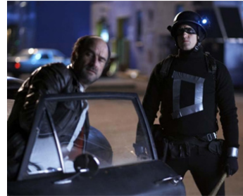
2009 DEFENDOR, HÉROS OU ZÉRO (Defendor) de Peter Stebbings avec Woody Harrelson