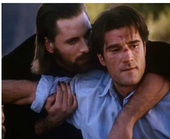
1995 THE PROPHECY (The Prophecy) de Gregory Widen avec Viggo Mortensen