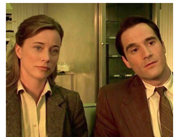
1997 BIENVENUE À GATTACA (Gattaca) d'Andrew Niccol avec Jayne Brook