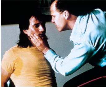
1989 MALAREK (Malarek) de Roger Cardinal avec Vittorio Rossi