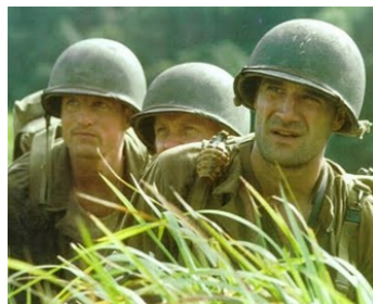
1998 LA LIGNE ROUGE (The Thin Red Line) de Terrence Malick avec Woody Harrelson