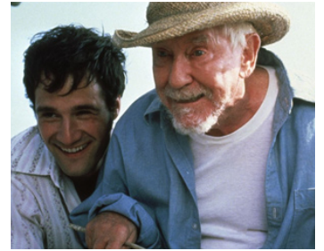
1988 PLEINE LUNE SUR BLUE WATER (Full Moon in Blue Water) de M. Radford avec B. Meredith