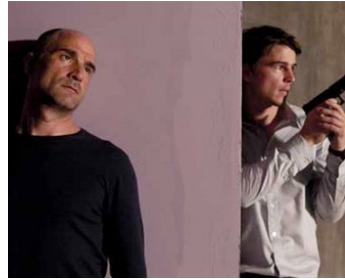
2009 JE VIENS AVEC LA PLUIE (Come with the Rain) de Tran Anh-Hung avec Josh Hartnett