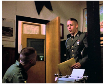
1987 JARDINS DE PIERRE (Gardens of Stone) de Francis Ford Coppola avec D. B. Sweeney