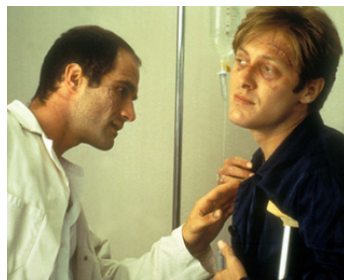
1996 CRASH (Crash) de David Cronenberg avec James Spader