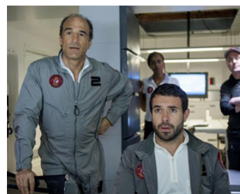
2013 LES DERNIERS JOURS SUR MARS (The Last Days on Mars) de Ruairi Robinson avec J. Harris