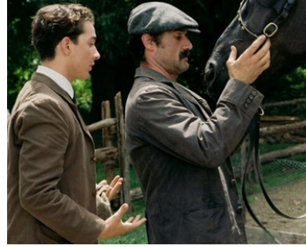
2005 UN PARCOURS DE LÉGENDE (The Greatest Game...) de Bill Paxton avec Shia LaBeouf