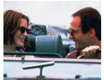
1994 CAMILLA (Camilla) de Deepa Mehta avec Bridget Fonda