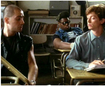
1987 LA VIE À L'ENVERS (Some Kind of Wonderful) d'Howard Deutch avec Eric Stoltz