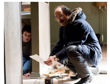
2010 LAISSE-MOI ENTRER (Let Me In) de Matt Reeves avec Kodi Smit McPhee