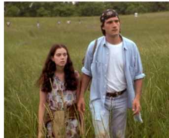
1994 EXOTICA (Exotica) d'Atom Egoyan avec Mia Kirshner