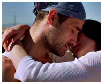
2000 DANCING AT THE BLUE IGUANA de Michael Radford avec Sheila Kelley