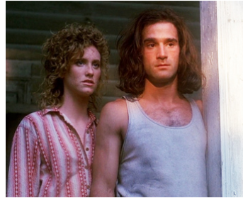
1990 LES TORTUES NINJA (Teenage Mutant Ninja Turtles) de Steve Barron avec Judith Hoag