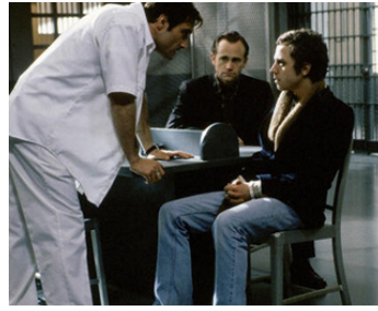
2001 EXÉCUTION CAPITALE (Shot in the Heart) d'A. Holland avec L. Tellegen, Giovanni Ribisi