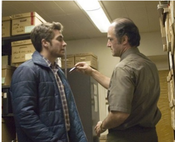
2007 ZODIAC (Zodiac) de David Fincher avec Jake Gyllenhaal