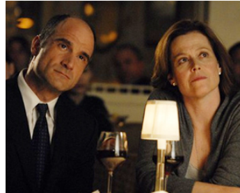
2007 LA FILLE DANS LE PARC (The Girl in the Park) de David Auburn avec S. Weaver