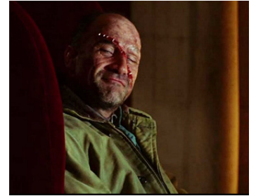
2010 SHUTTER ISLAND (Shutter Island) de Martin Scorsese